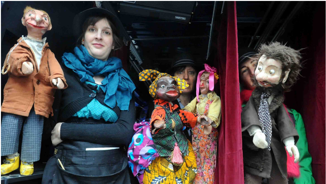
Trois comédiennes du TJP donnent voix et mouvement aux Pieds Nickelés.

Au final, les organisateurs, qui connaissent leurs classiques, ont choisi l'unité de lieu, hier à Erstein. Le théâtre de marionnettes du TJP de Strasbourg a donné deux représentations au marché (*). Les Pieds Nickelés s'y sont montrés.