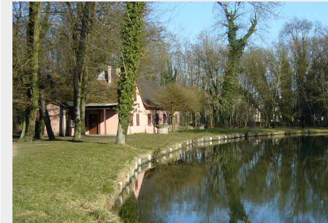
Point de départ de la marche gourmande : les étangs Augraben et le chalet des pêcheurs à Eschau.

L'association de pêche d'Eschau organise pour la première fois une marche gourmande d'environ 5 km à travers champs, prairies et forêt, le 22 avril, jour du vendredi saint. Un itinéraire gourmand, composé de sept étapes, permettra aux participants de déguster non seulement des spécialités à base de poisson mais également de découvrir un magnifique parcours autour de la commune d'Eschau. Le public pourra ainsi découvrir la faune et la flore de la forêt d'Eschau, ses sources, sa cascade, ses étangs, ses cours d'eau, la borne du millénaire... Un petit marché du terroir sera installé pour l'occasion sur la placette du restaurant « Sapin vert ». Y participeront également les associations des arboriculteurs et Eschau-Nature. Miel, lait, jus de pomme, fromages issus du lait des vaches qui se nourrissent exclusivement dans le ried, confitures de baies sauvages cueillies sur place, seront à la disposi-