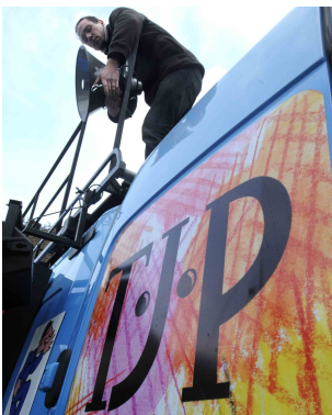
Une camionnette régie plateau pour un spectacle en plein air.

Elles leur ont donné chair avec leurs cordes vocales. « Ces paroles d'hommes portées par des voix de femme »